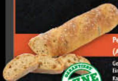
Pepperoni Baguette (Art.-Nr. 0789)

Gewicht = 80 g Einheiten pro Karton = 70 Stück (5,60 kg) Kartons pro Palette = 28 Stück