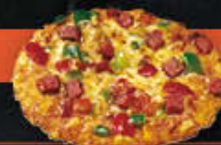
Pizza Salami (Art.-Nr. 3906)

Gewicht = 145 g Einheiten pro Karton = 36 Stück (5,22 kg) Kartons pro Palette = 80 Stück