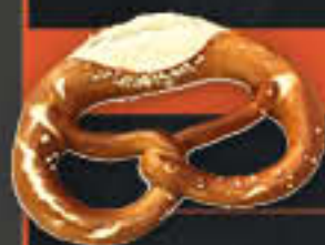
Laugenbrezel, handgeschlungen (Art.-Nr. 0110)

Laugengebäck und eine frischgebackene Brezel im Besonderen lassen vor allem in Süddeutschland und Österreich nicht nur Kinderaugen leuchten. Ihren Ursprung findet die Brezel vermutlich im Mittelalter als christliche Fastenspeise, deren Herstellung zeitlich reglementiert und nur einem bestimmten Personenkreis vorbehalten war. Heute sind Laugenprodukte aus den täglichen Brotkörben nicht mehr wegzudenken und werden am liebsten gleich unterwegs verzehrt.