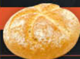
Kaiserbrötchen (Art-Nr. 4202)

Gewicht = 70 g Einheiten pro Karton = 100 Stück (7,00 kg) Kartons pro Palette = 24 Stück