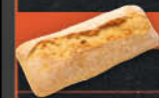
Ciabatta „mediterran“ (Art.-Nr. 6514)

Gewicht = 230 g Einheiten pro Karton = 40 Stück (9,20 kg) Kartons pro Palette = 24 Stück