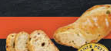
Pan Oli mit grünen Oliven (Art.-Nr. 4288)

Gewicht = 230 g Einheiten pro Karton = 40 Stück (9,20 kg) Kartons pro Palette = 24 Stück