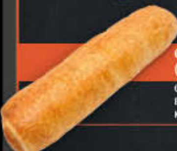
Geflügelrolle (Art.-Nr. 4807)

Gewicht = 145 g Einheiten pro Karton = 50 Stück (7,25 kg) Kartons pro Palette = 120 Stück