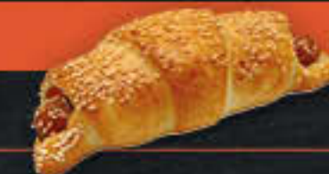
Wiener Würstchen Croissant (Art.-Nr. 6401)

Gewicht = 80 g Einheiten pro Karton = 90 Stück (7,20 kg) Kartons pro Palette = 40 Stück