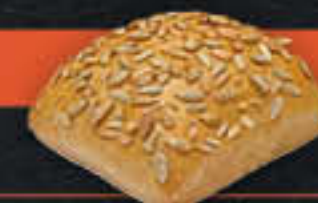
Sonnenblumenbrötchen (Art-Nr. 4215)

Gewicht = 100 g Einheiten pro Karton = 80 Stück (8,00 kg) Kartons pro Palette = 28 Stück