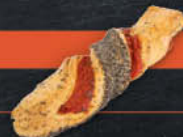
Mexikostange (Art.-Nr. 0512)

Gewicht = 150 g Einheiten pro Karton = 35 Stück (5,25 kg) Kartons pro Palette = 72 Stück