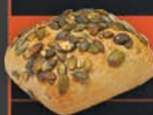
Kürbiskernbrötchen (Art-Nr. 4216)

Gewicht = 88 g Einheiten pro Karton = 100 Stück (8,80 kg) Kartons pro Palette = 24 Stück