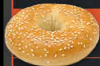
Bagel mit Sesam (Art-Nr. 7600)

Gewicht = 110 g Einheiten pro Karton = 60 Stück (6,60 kg) Kartons pro Palette = 32 Stück