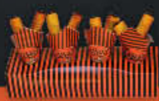
Ständer für 4 Schoggihörnchen oder -Sticks 40 cm, mit Steckführung (Art.-Nr. 99009)

Lernen Sie uns kennen! Für unsere Neukunden haben wir uns etwas ganz Besonderes ausgedacht: Sie erhalten Verpackungen im Gesamtwert von 214,- € gratis zu Ihrer Bestellung, wenn Sie uns 4 Wochen lang die Chance geben, Sie zu überzeugen! Nehmen Sie dazu einfach mit uns Kontakt auf und wir besprechen mit Ihnen alle Details. Wir freuen uns auf Sie!