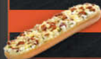
Baguettesnack Geflügelgyros (Art.-Nr. 0398)

Gewicht = 150 g Einheiten pro Karton = 24 Stück (3,60 kg) Kartons pro Palette = 90 Stück