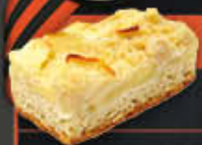
Apfelstreuselkuchen (Art-Nr. 1922) Gewicht = 130 g Einheiten pro Karton = 40 Stück (5,20 kg) Kartons pro Palette = 96 Stück