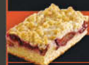
Pflaumenstreuselkuchen, geschnitten (Art-Nr. 1909) Gewicht = 130 g Einheiten pro Karton = 40 Stück (5,20 kg) Kartons pro Palette = 96 Stück