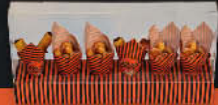
Ständer für 6 Schoggihörnchen oder -Sticks 60 cm, ohne Steckführung (Art.-Nr. 99016)