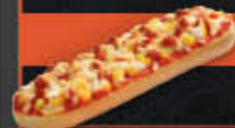
Baguettesnack Chorizo Salami (Art.-Nr. 0401)

Gewicht = 150 g Einheiten pro Karton = 24 Stück (3,60 kg) Kartons pro Palette = 90 Stück