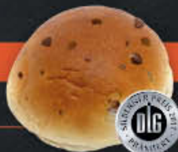
Rosinen-Milchbrötchen (Art-Nr. 5100)

Gewicht = 85 g Einheiten pro Karton = 52 Stück (4,42 kg) Kartons pro Palette = 44 Stück