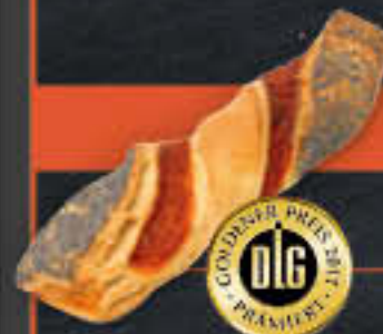
Knusperstick mit Mohn (Art.-Nr. 0519)

Gewicht = 150 g Einheiten pro Karton = 35 Stück (5,25 kg) Kartons pro Palette = 90 Stück