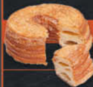
Croninut = Croissant + Donut (Art.-Nr. 0888)