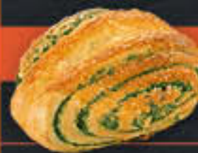
Spinat-Ricotta-Fächer (Art.-Nr. 0260)

Gewicht = 120 g Einheiten pro Karton = 56 Stück (6,72 kg) Kartons pro Palette = 64 Stück