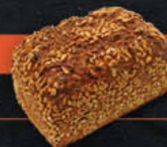
Sonnenblumenbrot (Art-Nr. 8617)

Gewicht = 750 g Einheiten pro Karton = 12 Stück (9,00 kg) Kartons pro Palette = 28 Stück