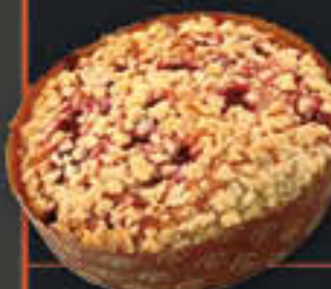
Kirschrührkuchen (Art-Nr. 8602) Mehrfruchtfüllung, gepudert Gewicht = 350 g Einheiten pro Karton = 21 Stück (7,35 kg) Kartons pro Palette = 44 Stück