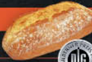
Rustino Baguettebrötchen (Art.-Nr. 4262)

Gewicht = 280 g Einheiten pro Karton = 28 Stück (7,84 kg) Kartons pro Palette = 28 Stück