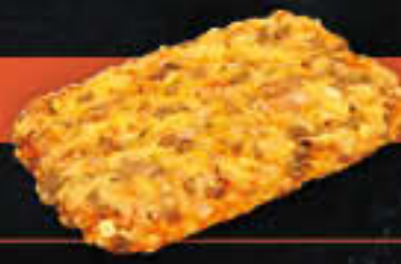
Pizza Thunfisch (Art.-Nr. 3920)

Gewicht = 205 g Einheiten pro Karton = 24 Stück (4,92 kg) Kartons pro Palette = 80 Stück