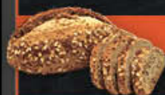
Kornback (Art-Nr. 8504)

Gewicht = 750 g Einheiten pro Karton = 14 Stück (10,50 kg) Kartons pro Palette = 44 Stück