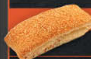
Käse-Knusperstange, Blätterteig (Art.-Nr. 4809)

Gewicht = 100 g Einheiten pro Karton = 40 Stück (4,00 kg) Kartons pro Palette = 88 Stück