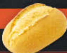
Bäckerbrötchen (Art-Nr. 5351)

Gewicht = 70 g Einheiten pro Karton = 100 Stück (7,00 kg) Kartons pro Palette = 24 Stück