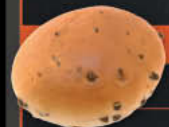
Schoko-Milchbrötchen (Art-Nr. 5101)

Gewicht = 65 g Einheiten pro Karton = 100 Stück (6,50 kg) Kartons pro Palette = 28 Stück