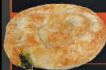
Schnecke mit Spinatfüllung (Art.-Nr. 0633)

Gewicht = 220 g Einheiten pro Karton = 45 Stück (9,90 kg) Kartons pro Palette = 64 Stück