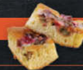
Rhabarberkuchen (Art.-Nr. 0830)

Gewicht = 110 g Einheiten pro Karton = 70 Stück (7,70 kg) Kartons pro Palette = 88 Stück