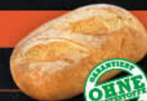
Tarragona Brot (Art.-Nr. 0660)

Gewicht = 300 g Einheiten pro Karton = 20 Stück (6,00 kg) Kartons pro Palette = 28 Stück