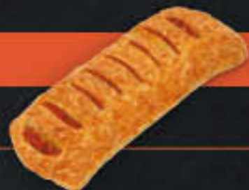
Tomatenstrudel (Art.-Nr. 3400)

Gewicht = 120 g Einheiten pro Karton = 50 Stück (6,00 kg) Kartons pro Palette = 120 Stück