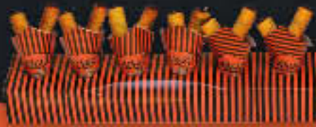
Ständer für 6 Schoggihörnchen oder -Sticks 60 cm, mit Steckführung (Art.-Nr. 99010)