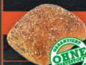
Weltmeisterbrötchen (Art.-Nr. 0788)

1 Karton enthält: 24 Blister mit je 2 Stk. à 100g