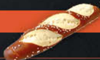
Laugenstange, geschnitten (Art.-Nr. 0723)

Gewicht = 90 g Einheiten pro Karton = 80 Stück (7,20 kg) Kartons pro Palette = 90 Stück