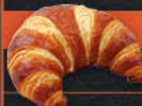
Laugen-Buttercroissant 22 % Butteranteil (Art.-Nr. 4835)

Gewicht = 80 g Einheiten pro Karton = 90 Stück (7,20 kg) Kartons pro Palette = 40 Stück