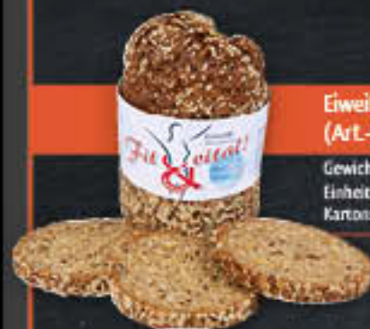
Eiweiß Abendbrot (Art-Nr. 0651)

Gewicht = 350 g Einheiten pro Karton = 13 Stück (4,55 kg) Kartons pro Palette = 40 Stück