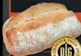
Wellenreiter, hell (Art-Nr. 0668)

Gewicht = 85 g Einheiten pro Karton = 80 Stück (6,80 kg) Kartons pro Palette = 28 Stück