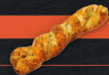
Bärlauch-Twister (Art.-Nr. 4313)

Gewicht = 90 g Einheiten pro Karton = 50 Stück (4,50 kg) Kartons pro Palette = 80 Stück