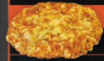
Pizza Margherita (Art.-Nr. 3905)

Gewicht = 120 g Einheiten pro Karton = 36 Stück (4,32 kg) Kartons pro Palette = 80 Stück