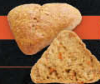
Joghurt Rübli 100g (Art-Nr. 4125)

Gewicht = 65 g Einheiten pro Karton = 60 Stück (3,90 kg) Kartons pro Palette = 48 Stück