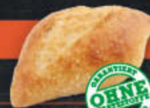
Panini Rustico hell (Art.-Nr. 0786)

Gewicht = 290 g Einheiten pro Karton = 30 Stück (8,70 kg) Kartons pro Palette = 24 Stück