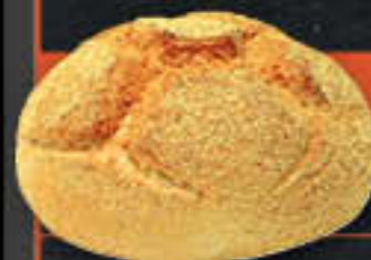
Sportlerbrot (Art-Nr. 8607)

Gewicht = 750 g Einheiten pro Karton = 15 Stück (11,25 kg) Kartons pro Palette = 28 Stück