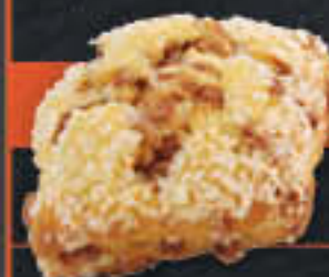
Zimthrötchen, roh (Art.-Nr. 0793)

1 Karton enthält: 24 Blister mit je 2 Stk. à 100g