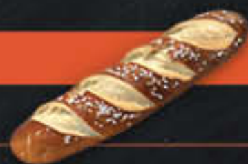
Laugenstange, geschnitten (Art.-Nr. 0149)

Gewicht = 100 g Einheiten pro Karton = 70 Stück (7,00 kg) Kartons pro Palette = 90 Stück