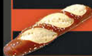
Laugenstange, geschnitten (Art.-Nr. 0420)

Gewicht = 100 g Einheiten pro Karton = 80 Stück (8,00 kg) Kartons pro Palette = 40 Stück