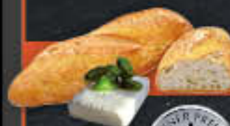
Zeusbaguette mit Peperoni & Weisskäse (Art.-Nr. 4318)

Gewicht = 80 g Einheiten pro Karton = 70 Stück (5,60 kg) Kartons pro Palette = 28 Stück