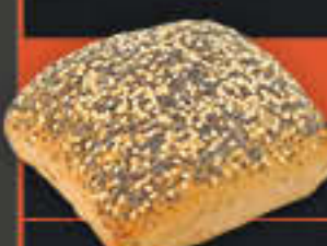
Weltmeisterbrötchen (Art-Nr. 4299)

Gewicht = 88 g Einheiten pro Karton = 100 Stück (8,80 kg) Kartons pro Palette = 24 Stück