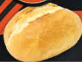
Frühstücksbrötchen (Art-Nr. 2097)

Gewicht = 65 g Einheiten pro Karton = 80 Stück (5,20 kg) Kartons pro Palette = 32 Stück