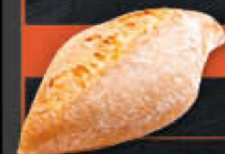
Rautinos natur (Art.-Nr. 4257)

Gewicht = 90 g Einheiten pro Karton = 90 Stück (8,10 kg) Kartons pro Palette = 24 Stück