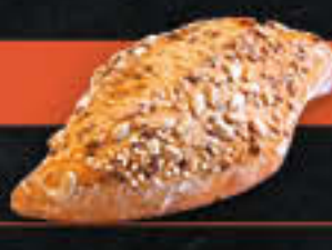
Rautinos Mehrkorn (Art.-Nr. 4259)

Gewicht = 80 g Einheiten pro Karton = 96 Stück (7,68 kg) Kartons pro Palette = 24 Stück