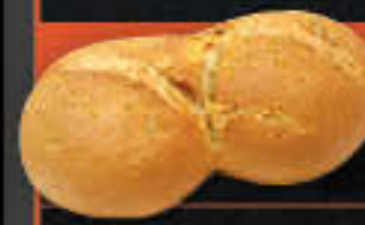
Doppelbrötchen mediterran, Peperoni (Art.-Nr. 4345)

Gewicht = 80 g Einheiten pro Karton = 96 Stück (7,68 kg) Kartons pro Palette = 24 Stück