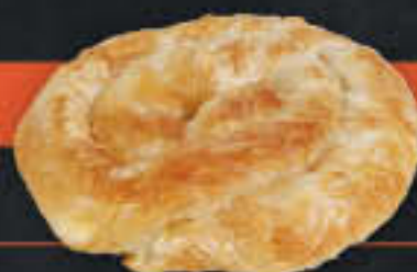
Schnecke mit Weisskäsefüllung (Art.-Nr. 0634)

Gewicht = 220 g Einheiten pro Karton = 45 Stück (9,90 kg) Kartons pro Palette = 64 Stück