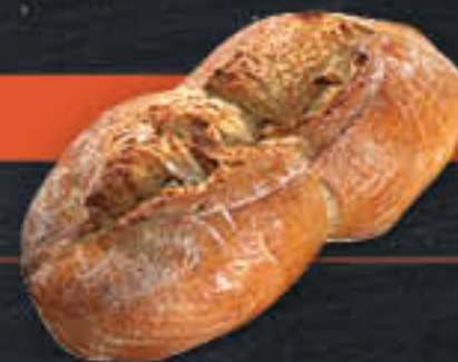
Brot rustikal 2 x 500 g (Art-Nr. 8505)

Gewicht = 430 g Einheiten pro Karton = 14 Stück (6,02 kg) Kartons pro Palette = 44 Stück