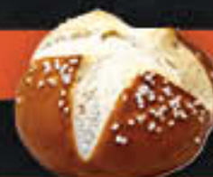
Laugenbrötchen, ungeschnitten (Art.-Nr. 4118)

Gewicht = 90 g Einheiten pro Karton = 70 Stück (6,30 kg) Kartons pro Palette = 90 Stück