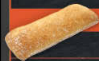
Ciabatta „classico“ (Art.-Nr. 4098)

Gewicht = 135 g Einheiten pro Karton = 40 Stück (5,40 kg) Kartons pro Palette = 42 Stück