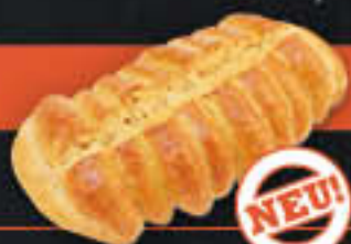
Abreiss, 8er (Art-Nr. 0831)

Gewicht = 85 g Einheiten pro Karton = 70 Stück (5,95 kg) Kartons pro Palette = 28 Stück