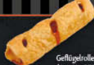
Geflügelrolle pikant (Art.-Nr. 0794)

Gewicht = 165 g Einheiten pro Karton = 40 Stück (6,60 kg) Kartons pro Palette = 88 Stück