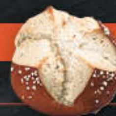
Laugenbrötchen, Kreuzschnitt (Art.-Nr. 0529)

Gewicht = 90 g Einheiten pro Karton = 70 Stück (6,30 kg) Kartons pro Palette = 90 Stück