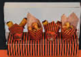
Ständer für 4 Schoggihörnchen oder -Sticks 40 cm, ohne Steckführung (Art.-Nr. 99015)