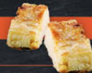
Apfel Nusskuchen (Art.-Nr. 0828)

Gewicht = 70 g Einheiten pro Karton = 18 Stück (1,26 kg) Kartons pro Palette = 88 Stück