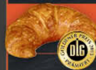
Premium-Buttercroissant 23% Butteranteil (Art.-Nr. 2002)

Gewicht = 80 g Einheiten pro Karton = 120 Stück (9,60 kg) Kartons pro Palette = 28 Stück