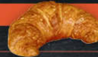
Premium-Buttercroissant 23% Butteranteil (Art.-Nr. 4232)

Gewicht = 80 g Einheiten pro Karton = 120 Stück (9,60 kg) Kartons pro Palette = 28 Stück