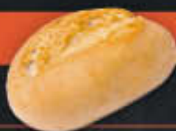
Schnittbrötchen (Art-Nr. 4097)

Gewicht = 65 g Einheiten pro Karton = 80 Stück (5,20 kg) Kartons pro Palette = 32 Stück