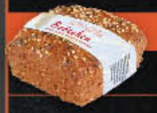
Low-Carb Brötchen (Art-Nr. 0612)

Gewicht = 75 g Einheiten pro Karton = 90 Stück (6,75 kg) Kartons pro Palette = 32 Stück