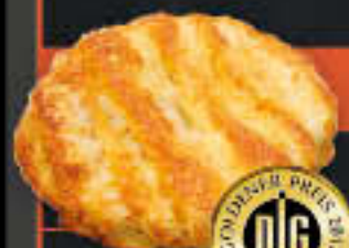
Käse-Mozzarella-Fächer (Art.-Nr. 6400)

Gewicht = 220 g Einheiten pro Karton = 45 Stück (9,90 kg) Kartons pro Palette = 64 Stück