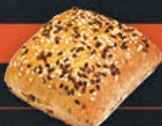
Mehrkornbrötchen (Art-Nr. 4214)

Gewicht = 88 g Einheiten pro Karton = 100 Stück (8,80 kg) Kartons pro Palette = 24 Stück