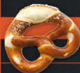
Laugenbrezel mit Butter (Art.-Nr. 4127)

Gewicht = 100 g Einheiten pro Karton = 72 Stück (7,20 kg) Kartons pro Palette = 40 Stück