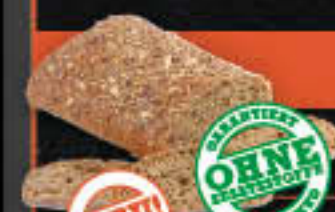
Premium-Mehrkornbrot (Art-Nr. 0790)

Gewicht = 750 g Einheiten pro Karton = 14 Stück (10,50 kg) Kartons pro Palette = 44 Stück