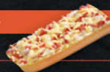
Baguettesnack Flammkuchen (Art.-Nr. 0399)

Gewicht = 150 g Einheiten pro Karton = 24 Stück (3,60 kg) Kartons pro Palette = 90 Stück