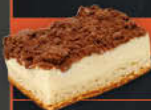
Schoko-Quarkkuchen (Art-Nr. 1924) Gewicht = 130 g Einheiten pro Karton = 40 Stück (5,20 kg) Kartons pro Palette = 96 Stück