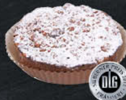
Käsetörtchen (Art-Nr. 0161) Gewicht = 100 g Einheiten pro Karton = 36 Stück (3,60 kg) Kartons pro Palette = 168 Stück