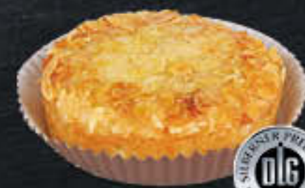
Schokotörtchen (Art-Nr. 0428) Gewicht = 100 g Einheiten pro Karton = 24 Stück (2,40 kg) Kartons pro Palette = 168 Stück