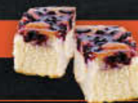
Schwarze Johannisbeerkuchen (Art.-Nr. 0829)

Gewicht = 85 g Einheiten pro Karton = 70 Stück (5,95 kg) Kartons pro Palette = 28 Stück