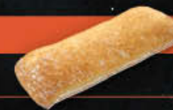
Ciabatta „classico“ (Art.-Nr. 4098)

Gewicht = 125 g Einheiten pro Karton = 75 Stück (9,38 kg) Kartons pro Palette = 24 Stück