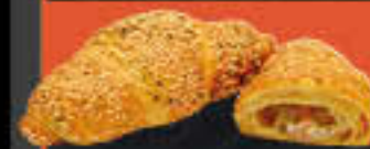
Putencroissant mit Frischkäse (Art.-Nr. 4309)

Gewicht = 105 g Einheiten pro Karton = 40 Stück (4,20 kg) Kartons pro Palette = 60 Stück