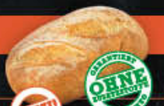
Tarragona Brot (Art-Nr. 0660)

Gewicht = 500 g Einheiten pro Karton = 12 Stück (6,00 kg) Kartons pro Palette = 32 Stück