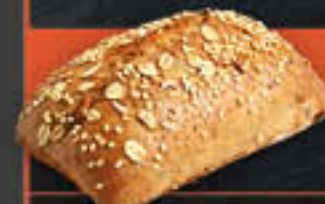
Müslibrötchen (Art-Nr. 4283)

Gewicht = 88 g Einheiten pro Karton = 100 Stück (8,80 kg) Kartons pro Palette = 24 Stück