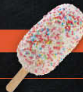
Kuchen am Stiel Nuss (Art-Nr. 0692) Gewicht = 60 g Einheiten pro Karton = 24 Stück (1,44 kg) Kartons pro Palette = 96 Stück