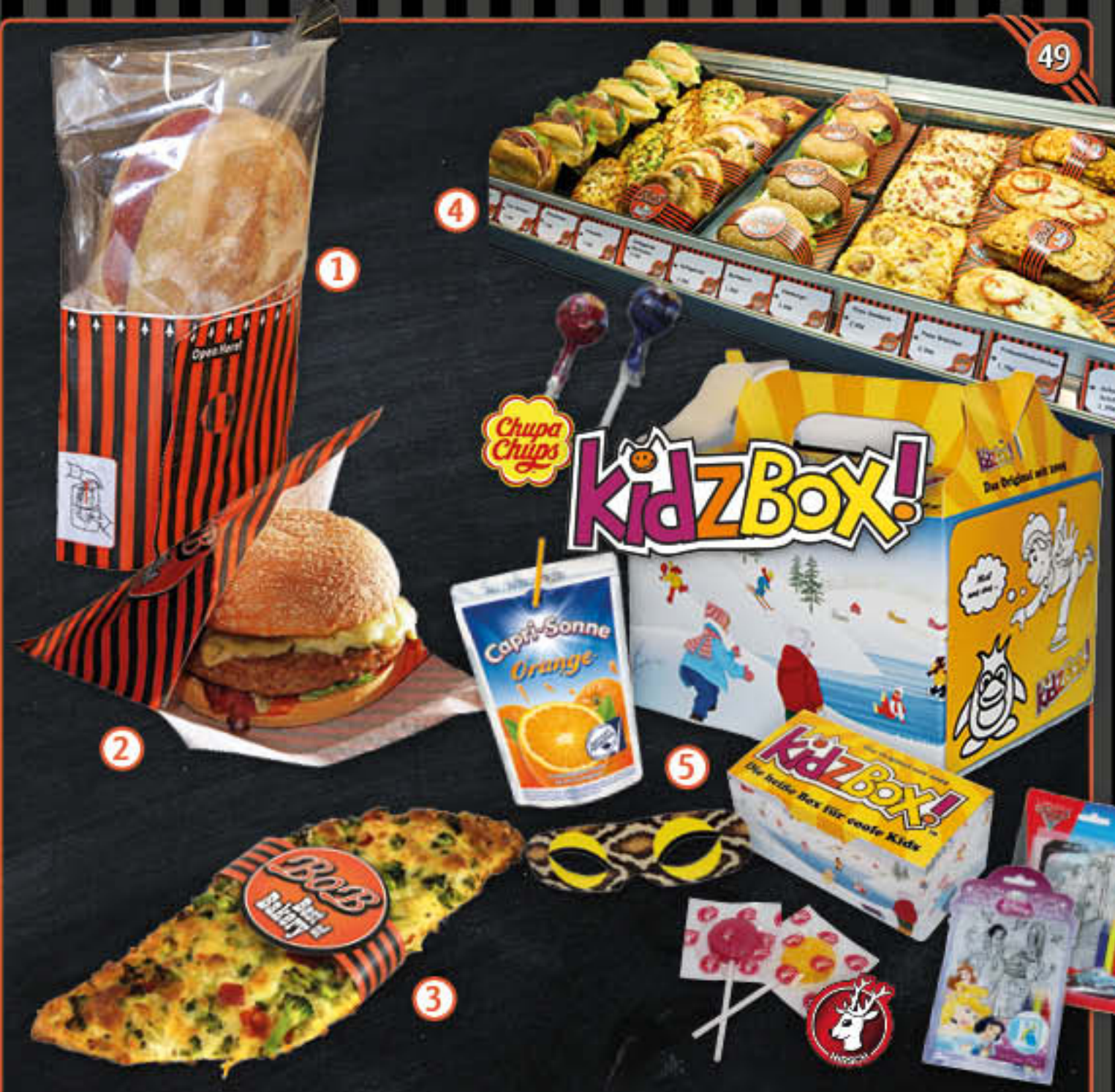
Faltenbeutel 14 x 32 cm (Art.-Nr. 99001)

Kostenlose Bestellhotline: 08000 555 966 Bestellfax: 01805 555 963 Best of Bakery GmbH, Mail: info@bestofbakery.de, Internet: www.bestofbakery.de www.facebook.com/BoBakery