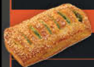
Spinat-Käse-Strudel (Art.-Nr. 3803)

Gewicht = 120 g Einheiten pro Karton = 50 Stück (6,00 kg) Kartons pro Palette = 60 Stück