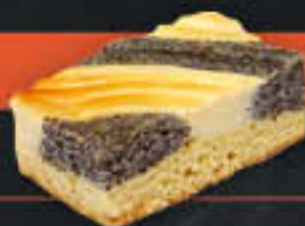
Mohn-Käsekuchen (Art-Nr. 1923) Gewicht = 130 g Einheiten pro Karton = 40 Stück (5,20 kg) Kartons pro Palette = 96 Stück