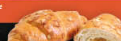
Marzipan-Buttercroissant (Art.-Nr. 4308)

Gewicht = 100 g Einheiten pro Karton = 68 Stück (6,80 kg) Kartons pro Palette = 54 Stück