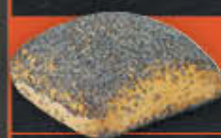
Mohnkecke (Art-Nr. 4223)

Gewicht = 100 g Einheiten pro Karton = 90 Stück (9,00 kg) Kartons pro Palette = 24 Stück