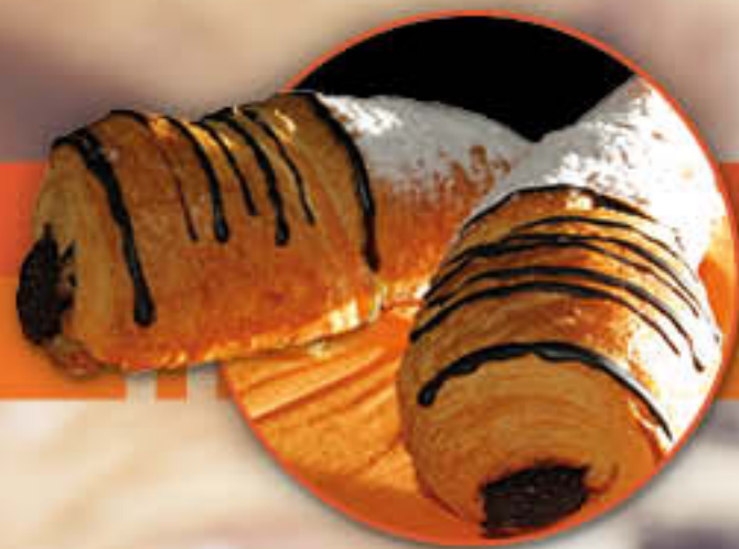
Schoggihörnchen (Art.-Nr. 0499)

Der Duft frischgebackener Croissants führt Ihre Kunden vom „Coffee-to-go“ direkt an die Backwarenthek und somit zur ersten Tagesmahlzeit. Unsere herzhaften Variationen, z.B. gefüllt mit Schinken & Käse oder Pute & Frischkäse, stillen den „kleinen Hunger zwischendurch“.