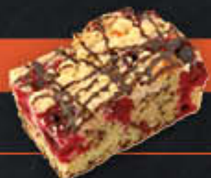
Kirschrührkuchen, geschnitten (Art-Nr. 1905) Gewicht = 110 g Einheiten pro Karton = 40 Stück (4,40 kg) Kartons pro Palette = 96 Stück