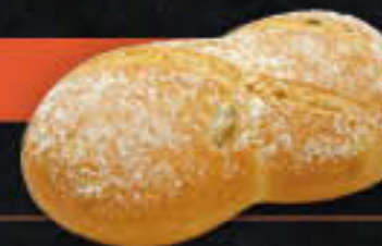
Doppelbrötchen mediterran, grüne Olive (Art.-Nr. 4346)

Gewicht = 125 g Einheiten pro Karton = 75 Stück (9,38 kg) Kartons pro Palette = 24 Stück