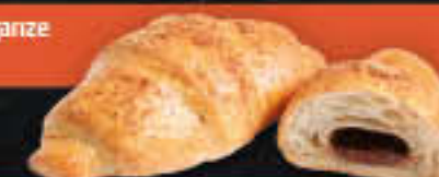
Buttercroissant mit Nuss-Nougatcreme (Art.-Nr. 4320)

Gewicht = 105 g Einheiten pro Karton = 68 Stück (7,14 kg) Kartons pro Palette = 48 Stück