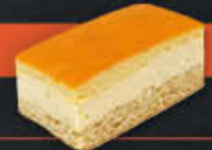
Käse Eierschnecke (Art-Nr. 1928) Gewicht = 150 g Einheiten pro Karton = 40 Stück (6,00 kg) Kartons pro Palette = 96 Stück