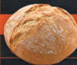
Rustikales Bauernbrötchen (Art-Nr. 1786)

Gewicht = 110 g Einheiten pro Karton = 56 Stück (6,16 kg) Kartons pro Palette = 24 Stück