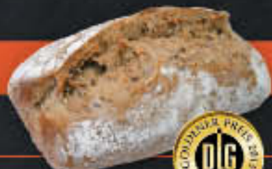
Wellenreiter, dunkel (Art-Nr. 0669)

Gewicht = 110 g Einheiten pro Karton = 60 Stück (6,60 kg) Kartons pro Palette = 32 Stück