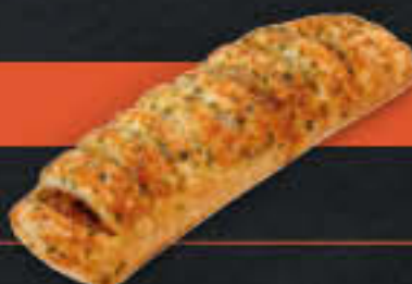
Antipasti-Snack (Art.-Nr. 6403)

Gewicht = 165 g Einheiten pro Karton = 80 Stück (13,20 kg) Kartons pro Palette = 40 Stück