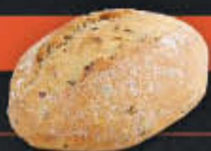
Dinkelcrusty, halbgebacken (Art-Nr. 0394)

Gewicht = 120 g Einheiten pro Karton = 70 Stück (8,40 kg) Kartons pro Palette = 44 Stück