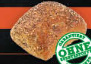
Weltmeisterbrötchen (Art-Nr. 0788)

Gewicht = 80 g Einheiten pro Karton = 100 Stück (8,00 kg) Kartons pro Palette = 24 Stück