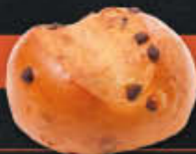
Schokobrotchen (Art-Nr. 0425)

Gewicht = 65 g Einheiten pro Karton = 100 Stück (6,50 kg) Kartons pro Palette = 28 Stück