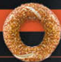
Simit mit Sesam (Art-Nr. 0638)