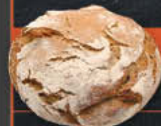
Rustikales Landbrot (Art-Nr. 8620)

Gewicht = 1000 g Einheiten pro Karton = 12 Stück (12,00 kg) Kartons pro Palette = 28 Stück