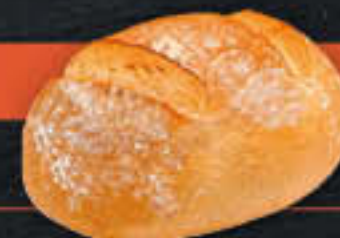
Bauernweizen (Art-Nr. 8506)

Gewicht = 750 g Einheiten pro Karton = 16 Stück (12,00 kg) Kartons pro Palette = 28 Stück