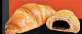
Buttercroissant mit Schokocreme (Art.-Nr. 4823)

Gewicht = 90 g Einheiten pro Karton = 64 Stück (5,76 kg) Kartons pro Palette = 60 Stück