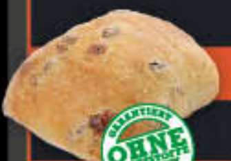
Rosinenbrötchen (Art-Nr. 0787)

Gewicht = 65 g Einheiten pro Karton = 40 Stück (2,60 kg) Kartons pro Palette = 72 Stück