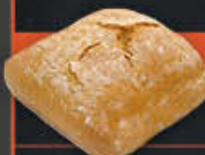
Schusterjungs (Art-Nr. 4217)

Gewicht = 75 g Einheiten pro Karton = 80 Stück (6,00 kg) Kartons pro Palette = 36 Stück