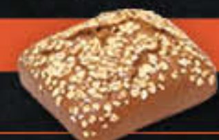
Wikingerbrötchen „dunkel“ (Art-Nr. 5350)

Gewicht = 85 g Einheiten pro Karton = 90 Stück (7,65 kg) Kartons pro Palette = 28 Stück