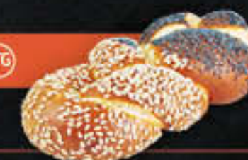
Laugenzopf (Art.-Nr. 4119)

Gewicht = 85 g Einheiten pro Karton = 120 Stück (10,20 kg) Kartons pro Palette = 40 Stück