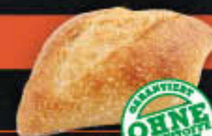
Panini Rustico Hell (Art.-Nr. 0786)

Gewicht = 85 g Einheiten pro Karton = 70 Stück (5,95 kg) Kartons pro Palette = 28 Stück