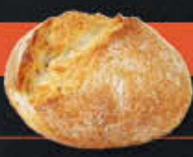
Potatoo hell (Art-Nr. 6007)

Gewicht = 110 g Einheiten pro Karton = 56 Stück (6,16 kg) Kartons pro Palette = 24 Stück