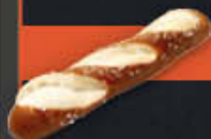
Laugenstange, ungeschnitten (Art.-Nr. 4122)

Gewicht = 90 g Einheiten pro Karton = 80 Stück (7,20 kg) Kartons pro Palette = 90 Stück