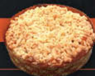
Apfelrührkuchen (Art-Nr. 8601) Gewicht = 350 g Einheiten pro Karton = 21 Stück (7,35 kg) Kartons pro Palette = 44 Stück