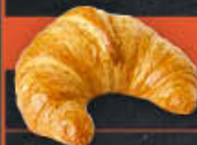
Buttergipfel (Art.-Nr. 4023)

Gewicht = 65 g Einheiten pro Karton = 60 Stück (3,90 kg) Kartons pro Palette = 60 Stück