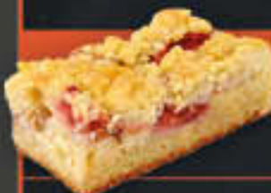
Erdbeer-Rhabarberschnitte (Art-Nr. 1926) Gewicht = 120 g Einheiten pro Karton = 40 Stück (4,80 kg) Kartons pro Palette = 96 Stück