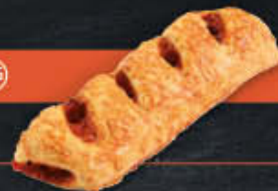
Pizzatasche Salami (Art.-Nr. 3921)

Gewicht = 120 g Einheiten pro Karton = 48 Stück (5,76 kg) Kartons pro Palette = 72 Stück