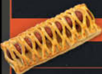
Hot Dog de Luxe (Art.-Nr. 3804)

Gewicht = 130 g Einheiten pro Karton = 50 Stück (6,50 kg) Kartons pro Palette = 60 Stück