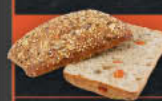
Powerbrötchen (Art-Nr. 0304)

Gewicht = 88 g Einheiten pro Karton = 100 Stück (8,80 kg) Kartons pro Palette = 24 Stück