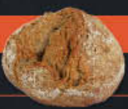
Potatoo dunkel (Art-Nr. 6008)

Gewicht = 110 g Einheiten pro Karton = 56 Stück (6,16 kg) Kartons pro Palette = 24 Stück