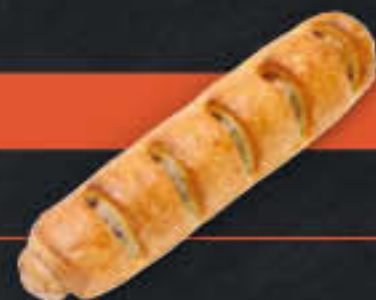
Premium-Geflügelrolle (Art.-Nr. 3805)

Gewicht = 145 g Einheiten pro Karton = 50 Stück (7,25 kg) Kartons pro Palette = 120 Stück