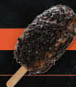
Kuchen am Stiel Schoko (Art-Nr. 0691) Gewicht = 60 g Einheiten pro Karton = 24 Stück (1,44 kg) Kartons pro Palette = 96 Stück