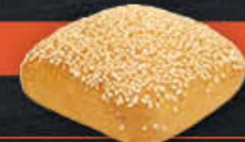
Sesamecke (Art-Nr. 4224)

Gewicht = 88 g Einheiten pro Karton = 100 Stück (8,80 kg) Kartons pro Palette = 24 Stück