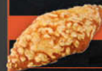
Käsebrötchen (Art-Nr. 0331)

Gewicht = 100 g Einheiten pro Karton = 80 Stück (8,00 kg) Kartons pro Palette = 24 Stück