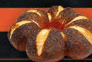
Laugenkranz mit Mohn, fertig gebacken (Art.-Nr. 4333)

Gewicht = 300 g Einheiten pro Karton = 9 Stück (2,70 kg) Kartons pro Palette = 48 Stück