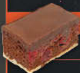
Kirschnitte dunkel, geschnitten (Art-Nr. 1907) Gewicht = 120 g Einheiten pro Karton = 40 Stück (4,80 kg) Kartons pro Palette = 96 Stück