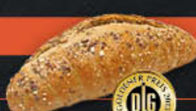
Kornquarkstange (Art-Nr. 5353)

Gewicht = 88 g Einheiten pro Karton = 100 Stück (8,80 kg) Kartons pro Palette = 24 Stück