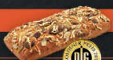
Sennerfladen (Art-Nr. 0205)

Gewicht = 88 g Einheiten pro Karton = 100 Stück (8,80 kg) Kartons pro Palette = 24 Stück