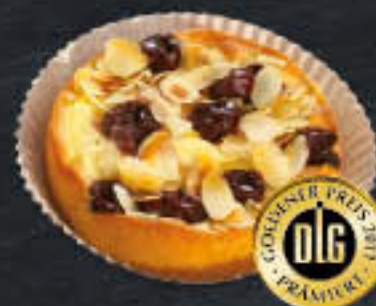
Kirschtörtchen (Art-Nr. 0269) Gewicht = 100 g Einheiten pro Karton = 36 Stück (3,60 kg) Kartons pro Palette = 168 Stück