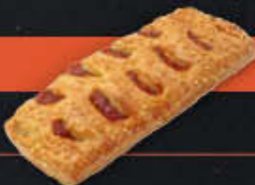
Currywurst-Snack (Art.-Nr. 3700)

Gewicht = 120 g Einheiten pro Karton = 40 Stück (4,80 kg) Kartons pro Palette = 120 Stück