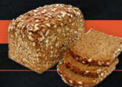
Korn an Korn (Art-Nr. 8616)

Gewicht = 750 g Einheiten pro Karton = 15 Stück (11,25 kg) Kartons pro Palette = 28 Stück