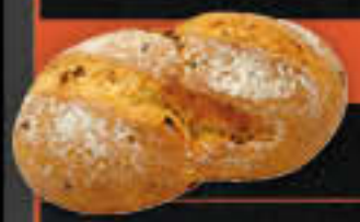
Doppelbrötchen mediterran, Tomate (Art.-Nr. 4344)

Gewicht = 125 g Einheiten pro Karton = 75 Stück (9,38 kg) Kartons pro Palette = 24 Stück