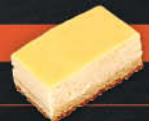
Käsekuchen, geschnitten (Art-Nr. 1906) Gewicht = 130 g Einheiten pro Karton = 40 Stück (5,20 kg) Kartons pro Palette = 96 Stück