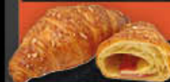
Schinken-Käse-Buttercroissant, ganze Schinkenscheibe (Art.-Nr. 4822)

Gewicht = 105 g Einheiten pro Karton = 68 Stück (7,14 kg) Kartons pro Palette = 54 Stück