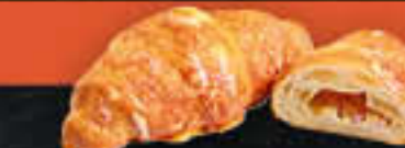
Schinken-Käse-Croissant (Art.-Nr. 0377)

Gewicht = 105 g Einheiten pro Karton = 64 Stück (6,72 kg) Kartons pro Palette = 60 Stück