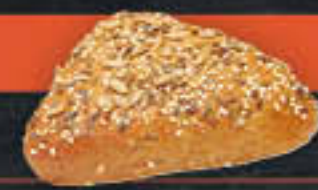
Dreispietz (Art-Nr. 4222)

Gewicht = 90 g Einheiten pro Karton = 60 Stück (5,40 kg) Kartons pro Palette = 42 Stück