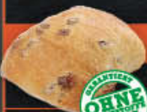
Rosinenbrötchen (Art.-Nr. 0787)

1 Karton enthält: 24 Blister mit je 2 Stk. à 100g