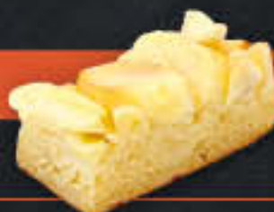
Apfelkuchen offen ohne Rosinen (Art-Nr. 1927) Gewicht = 110 g Einheiten pro Karton = 40 Stück (4,40 kg) Kartons pro Palette = 96 Stück