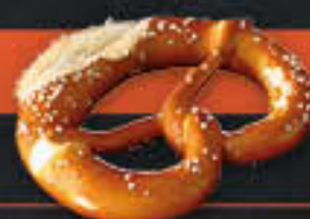
Laugenbrezel „schwäbisch“, ungeschnitten (Art.-Nr. 4329)

Gewicht = 120 g Einheiten pro Karton = 72 Stück (8,64 kg) Kartons pro Palette = 40 Stück