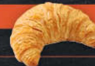
Französisches Buttercroissant 22% Butteranteil (Art.-Nr. 4834)

Gewicht = 80 g Einheiten pro Karton = 120 Stück (9,60 kg) Kartons pro Palette = 28 Stück