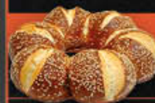
Laugenkranz mit Sesam, fertig gebacken (Art.-Nr. 4335)

Gewicht = 120 g Einheiten pro Karton = 100 Stück (12,00 kg) Kartons pro Palette = 40 Stück